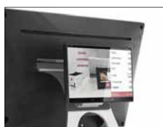
Display 7" lato cliente