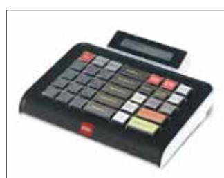
Tastiera 40 tasti + Display